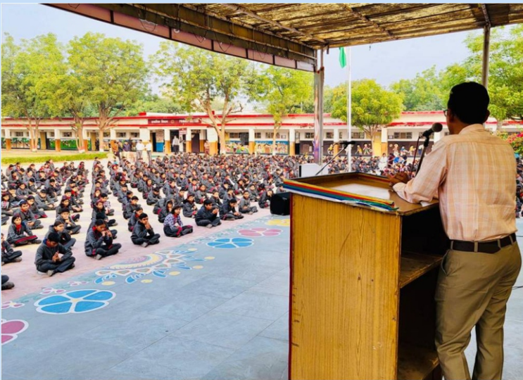
केन्द्रीय विद्यालय जोधपुर के छात्रों को सतत विकास पर व्याख्यान दिया गया